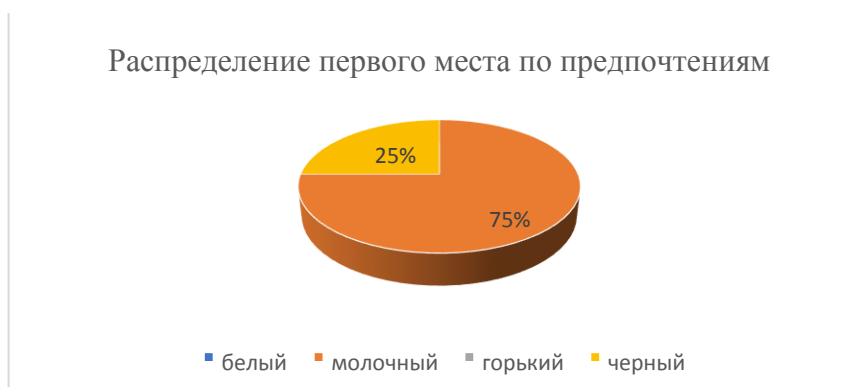
Рисунок 3. Пример оформления результатов анкетного опроса

Далее мы строим диаграмму по первому месту, его у нас присвоили 4 раза – это и есть 100 %, молочный шоколад на первое место поставили 3 человека, значит его доля =3:4=75\%