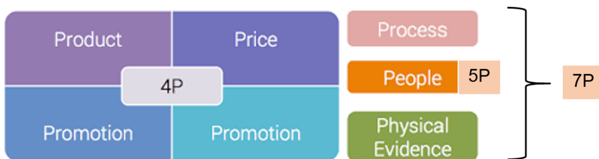
Рисунок 3 – Возможный состав комплекса маркетинга

Изначально комплекс маркетинга состоял из четырех элементов (4P), впоследствии усложнялся и в результате перешел в комплекс маркетинга 5P и 7P (рисунок 3).