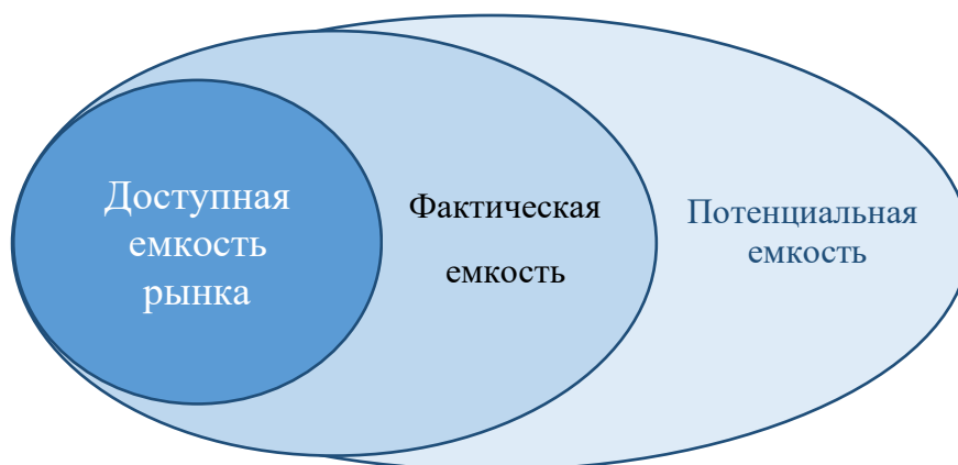
Рисунок 1 – Соотношение доступной, фактической и потенциальной емкости рынка

Доступная емкость. Это количество потребителей, на которые может претендовать рассматриваемая Вами компания с имеющимся предложением и его характеристиками.