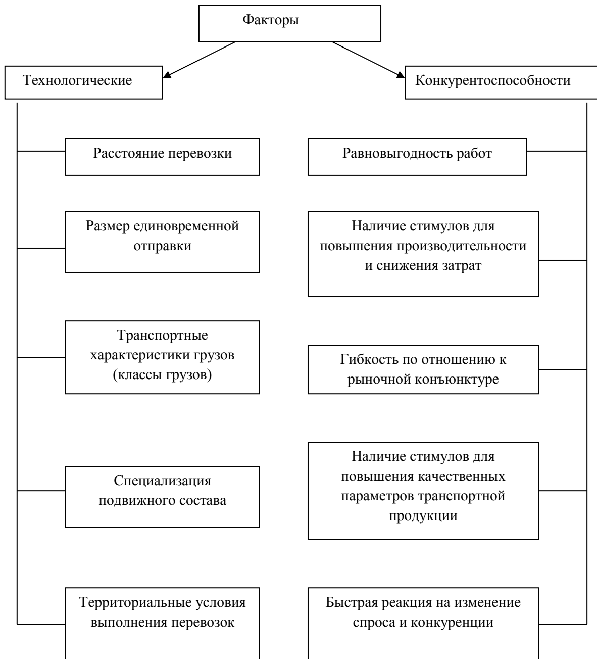
Рисунок 2.7. – Факторы, характеризующие принципы построения тарифных систем на транспорте