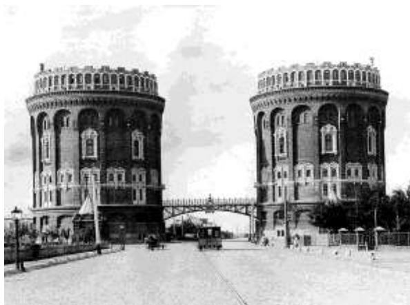
Рис.1. Водонапорные башни у Крестовской заставы (не сохранились) 4 .

Была завершена постройка Исторического музея (архитектор В. О.Шервуд ) и построено здание Городской Думы по проекту архитектора Д. Н. Чичагова (впоследствии Музей Ленина).