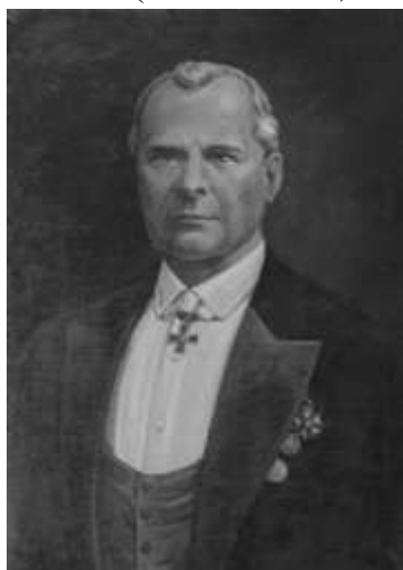
Григорий Григорьевич Елисеев (21 августа 1864, Санкт-Петербург —