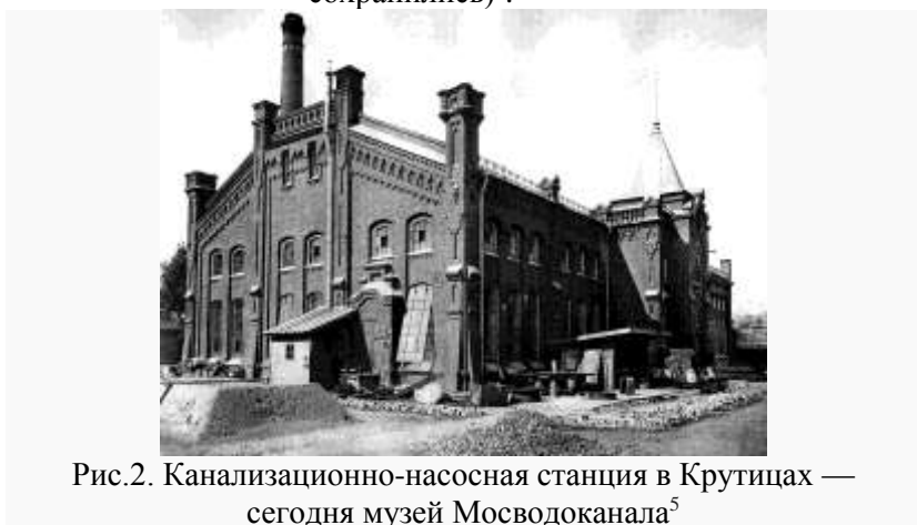
Рис.2. Канализационно-насосная станция в Крутицах — сегодня музей Мосводоканала 5