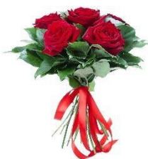
- 5 роз

В ряде случаев, чтобы избежать разночтений и упростить респондентом прохождение анкетирования варианты ответов на вопрос лучше представить в графическом виде. Например: «Какой букет при цене 1000 рублей Вы бы предпочли?»