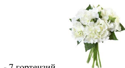
- 7 гортензий