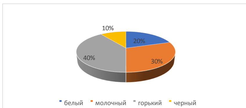
Рисунок 2 - Пример оформления результатов « Общее распределение без учета предпочтений»

Далее мы строим диаграмму по первому месту, его у нас присвоили 4 раза – это и есть 100 %, молочный шоколад на первое место поставили 3 человека, значит его доля =3:4=75\%