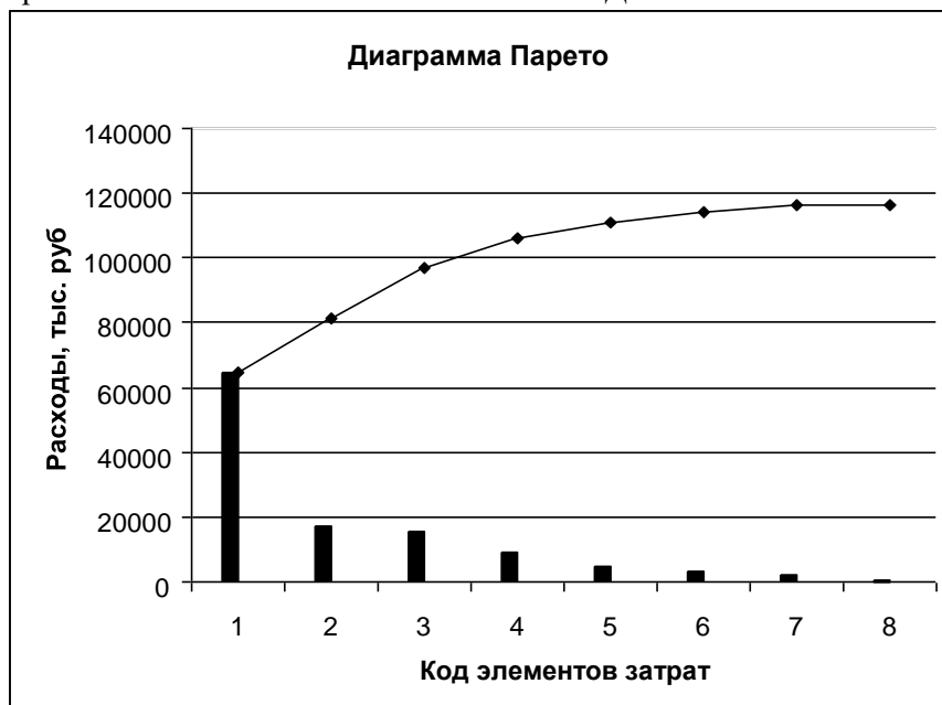
Рисунок 3.3. – Диаграмма Парето