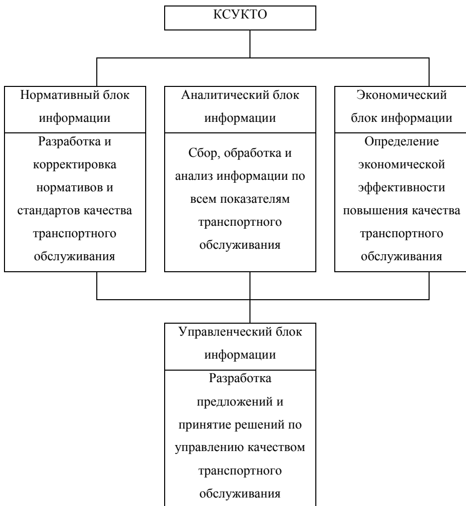
Рисунок 2.7. – Структура информационной системы менеджмента качества транспортного обслуживания